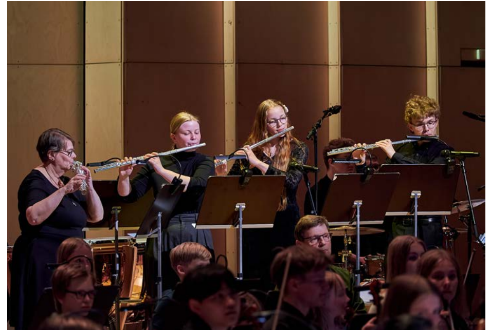
Ute blåser sommarvind.