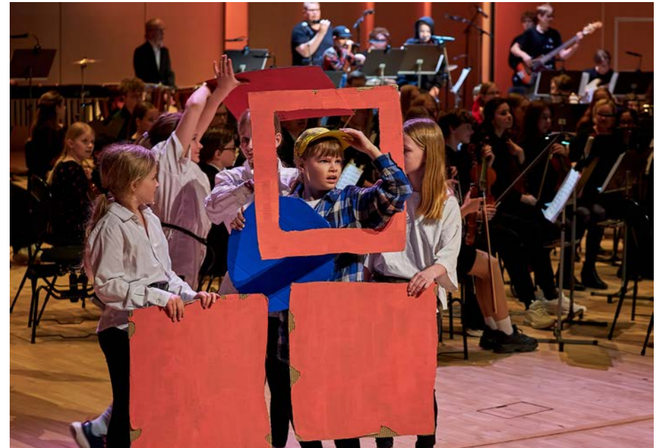
Traktor Alban.