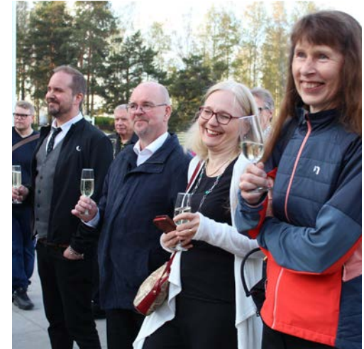
Neda: Vi höjer en skål för MIK 50 år.