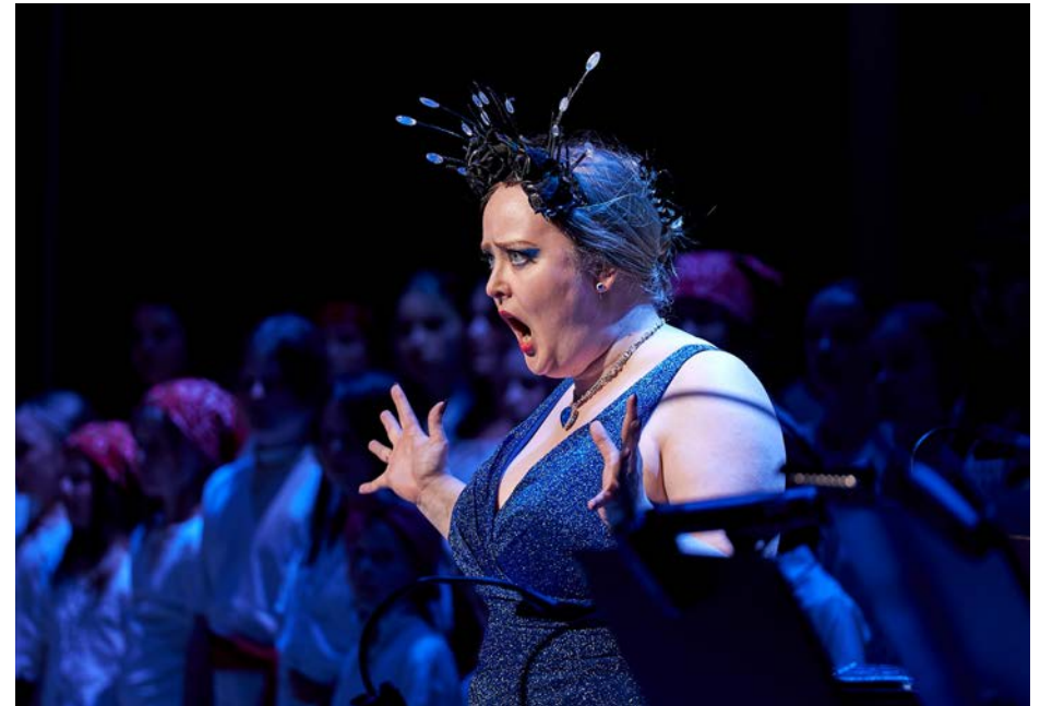
Nattens drottning.