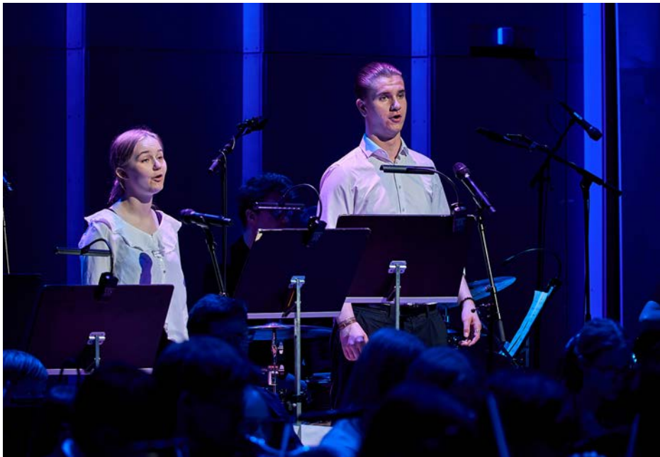
Dumma kungens slutsång.