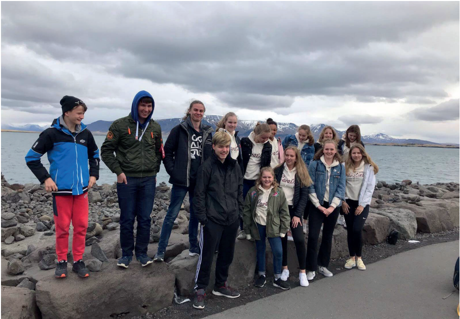
Körernas resa till Norbusang festivalen som i år ordnades på Island.