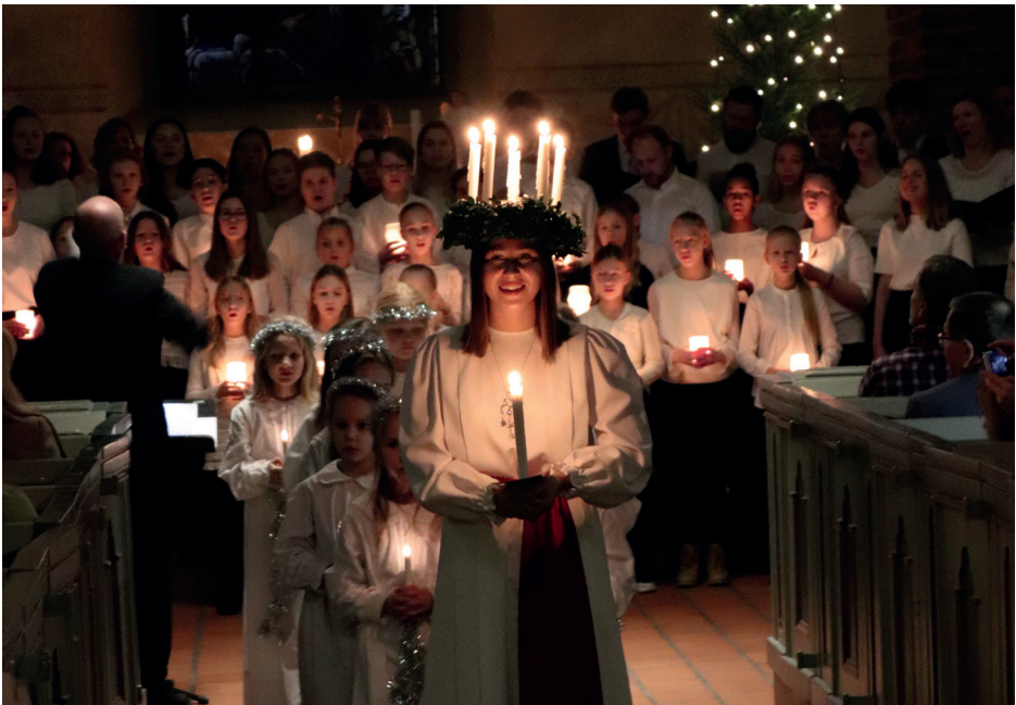
Esbo Lucia 2017 Saga Rekonen på MIKs julkonsert i Esbo domkyrka.